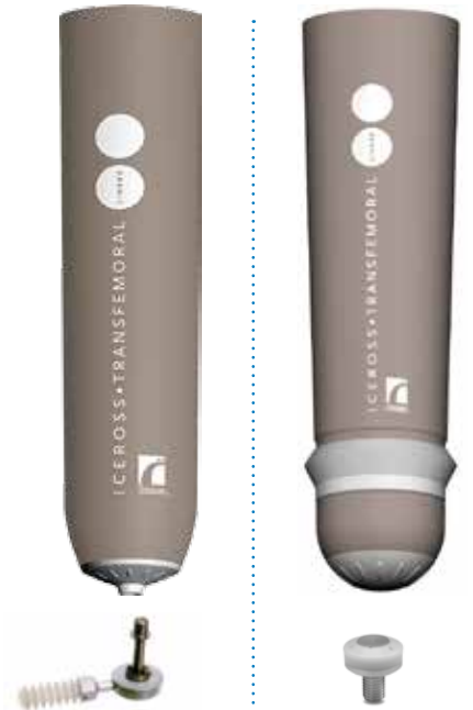
Icelock 600 Series

Iceross Transfemoral Locking Iceross Seal-In® X5