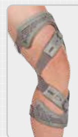
Ortéza Unloader One