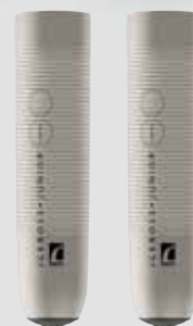
Iceross® Junior Dermo® et Stabulo