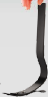
Cheetah® Xplore Junior